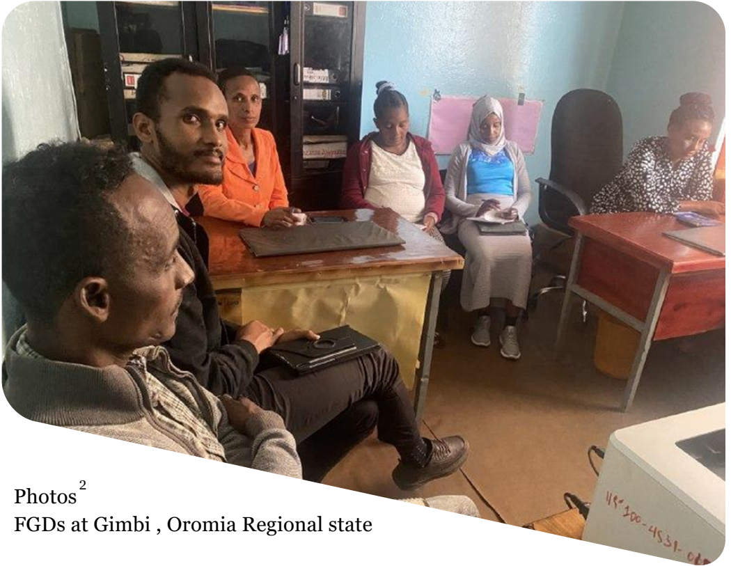
Photos 2 FGDs at Gimbi , Oromia Regional state