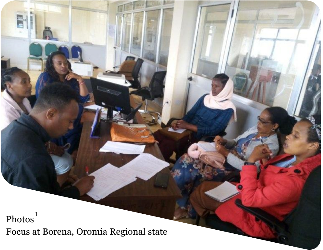
Photos 1 Focus at Borena, Oromia Regional state